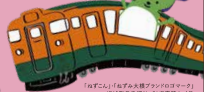
「ねずこん」・「ねずみ大根ブランドロゴマーク」 坂城町長承認 No.31 坂商第4-4号